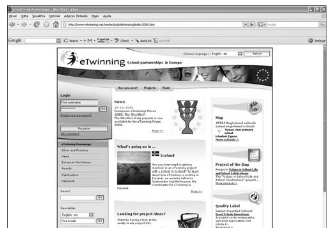
eTwinning ( http://www.etwinning.net ).